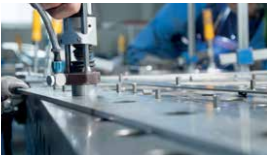
Bearbeitung & Montage