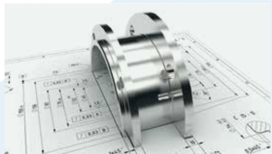
Fräs- & Drehteile