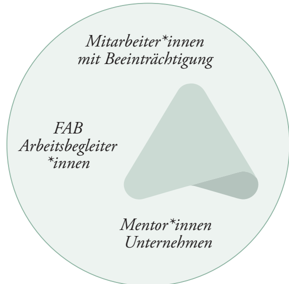
GRAFIK FAB: DAS MENTOR*INNEN-SYSTEM

Die enge Zusammenarbeit zwischen Mitarbeiter*innen, Mentor*innen der Firma und der Arbeitsbegleitung erfordert gegenseitiges Vertrauen und laufende, gute Kommunikation.